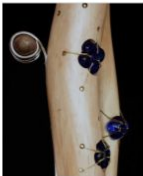
Le voyage... ou la soif de partir (extrait)